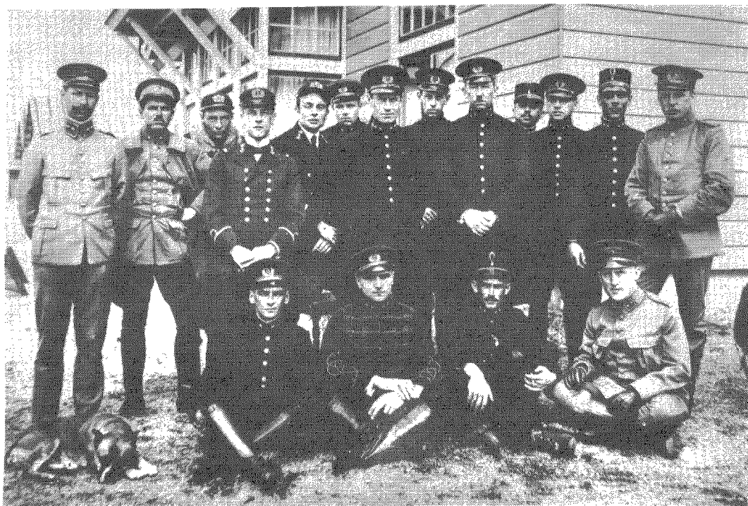
Een groep officieren in 1916.

In die tijd werden ook officieren van de Koninklijke Marine en van het Nederlandsch Indische Leger bij de Luchtvaartafdeling op Soesterberg opgeleid tot vlieger.