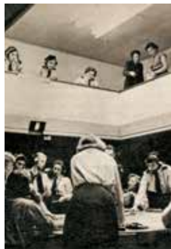
Rechts: Op het balkon volgen de waarnemers de bewegingen op de plottafel in luchtvaart- centrum Groningen.