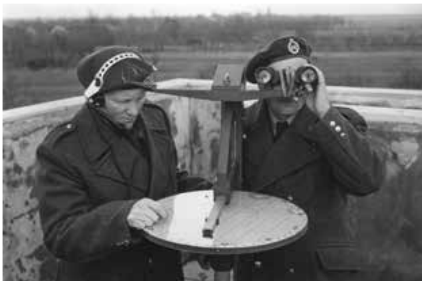
Luchtwachters op hun post op een toren elders in het land.

van posten op bestaande hoge gebouwen had wegens de lagere bouwkosten de voorkeur boven nieuw te bouwen torens. Voor de helft van de posten volstond een (eenvoudige) opbouw, op een fabriek, watertoren, molenromp of bunker. Op de andere helft van de benodigde locaties was geen geschikt hoog gebouw aanwezig. Daar was het Ministerie van Oorlog genoodzaakt speciaal ontworpen torens te bouwen, de luchtwachttorens. Voor de torens koos men hoge punten in het terrein, zoals heuvels, duintoppen en dijken, om de hoogte en daarmee de kosten te beperken,