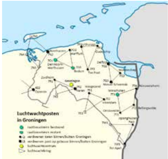
Rechts: Luchtwachtposten in Groningen. Samenstelling Sandra van Lochem

dediging kwamen in deze vijfdaagse oefening aan bod, namelijk detectie, herkenning en identificatie, interceptie en vernietiging. Doel van de oefening was het testen van de samenwerking tussen nationale luchtmacht, luchtdoelartillerie en luchtwachtdienst. Vier dagen lang voerden vliegtuigen gesimuleerde luchtaanvallen uit op Nederlands en Belgisch grondgebied; 650 vliegtuigen uit België, Engeland en Duitsland waren daarbij in de lucht en Nederlandse straaljagers moesten die tijdig zien te onderscheppen. 19