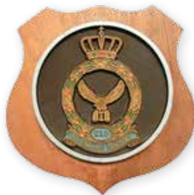
Rechts: De trouw aan het KLD werd bij de opheffing in 1964 beloond met een oorkonde en afscheidschildje. Particuliere collectie.

strikt een nationale taak, maar werd deze steeds meer internationaal georganiseerd en geïntegreerd in de NAVO-luchtverdediging. Niet lang nadat het KLD-netwerk eindelijk volledig gereed en operationeel was, bleek het achterhaald en overbodig te zijn geworden.