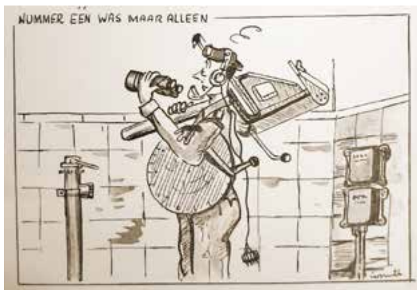
Notoire thuisblijvers bij de oefeningen en lessen kregen een kaartje.

Luchtwachtdienst. De werkzaamheden konden namelijk grotendeels in de vrije tijd naast het gewone dagelijkse werk verricht worden. De posten waren niet permanent bezet, alleen tijdens oefeningen en in geval er sprake zou zijn van oorlogsdreiging. Voor buitengewoon dienstplichtigen was dit een aantrekkelijk perspectief. Met de roerige situatie in Nederlands-Indië vers in het geheugen hoopte men zo toekomstige uitzending naar het buitenland te voorkomen. Met behoud van de eigen werkkring droeg men ondertussen toch bij aan een veiliger vaderland. Ook belangstelling voor vliegtuigen was een reden zich bij het KLD aan te melden. 13