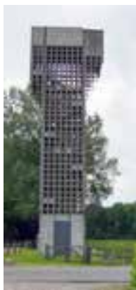
De luchtwachttorens te Winschoten.