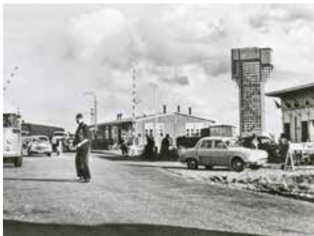
Links: De luchtwachtoren van Nieuweschans stond vlakbij de grensovergang. Ansichtkaart verzonden in 1959.