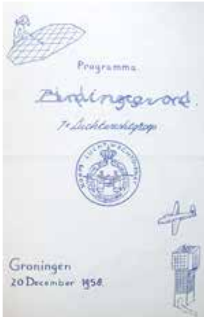
Links: Voorzijde programma bindingsavond luchtwachtgroep 7 in 1958 in Groningen.