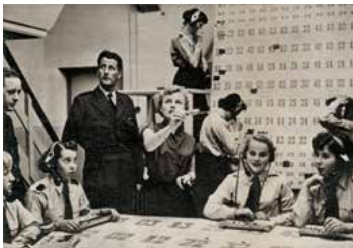
Links: Plottafel en longe range bord in luchtvaartcentrum Groningen.