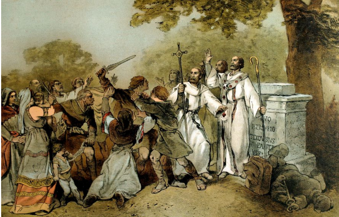
Willibrord op Walcheren, schoolplaat van Charles Rochussen (1824-1894). Het heidense afgodsbeeld dat Rochussen heeft weergegeven is een Romeins beeld van Mercurius.

De resten van de vroeg-middeleeuwse nederzetting op Walcheren waren tot in de negentiende eeuw zichtbaar, doch zijn nu door de voortschrijdende kusterosie te ver van de laagwaterlijn verwijderd om ooit nog tevoorschijn te komen. Tegenwoordig komen op het strand slechts af en toe structuren vrij, zoals ontwateringsloten, die oorspronkelijk meer landinwaarts gelegen waren.