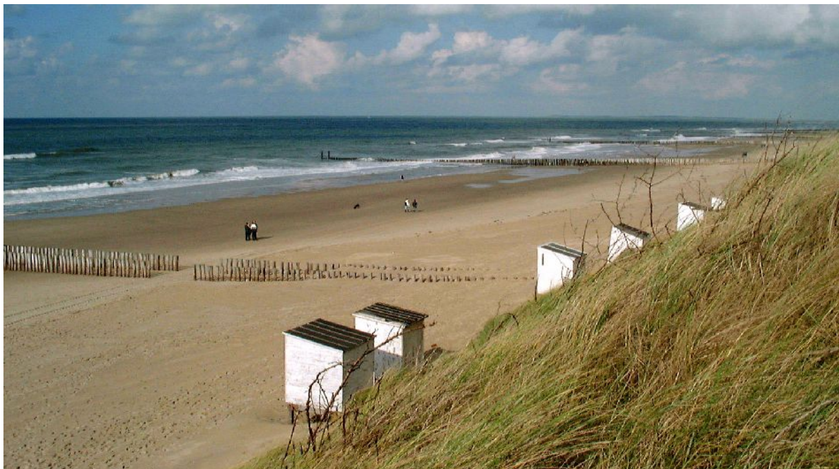
Het strand bij Westhove.

nederzetting was weinig landbouwgrond beschikbaar. Er konden schapen op de schorren en de kreekruggen worden gehouden 6 en uit het verzilte veen werd zout gewonnen 7 . De plaats dankte haar bestaan dan ook voornamelijk aan de handel. De lokatie aan een beschutte kreek nabij de monding van de Schelde maakte de nederzetting welhaast een ideale plaats voor overzeese handel. Een koperen schaalte van een muntbalans is de stille getuige van mercantiele activiteiten, die kunnen wijzen op contacten buiten het Frankische rijk 8 . De gunstige ligging ten opzichte van de oversteek naar Engeland was een gegeven dat al door de Romeinen op waarde werd geschat en ook door de Friese handelslieden zal zijn benut. De gevonden munten tonen aan dat er volop betrekkingen met Engeland waren. Zeeland sluit toponymisch dan ook bij het Oud-Engels aan 9 . Mogelijk was de plaats een schakel in de slavenhandel van Engeland naar Verdun, de grootste slavenmarkt van het Frankische rijk. Zoals Dorestad lag op de grens van de handelssferen van het Austrasische achterland en de Noordzee, zo vormde de nederzetting op Walcheren de verbinding tussen Neustrië en de zee. De plaats kan dan ook worden gezien als een tegenhanger van Dorestad wat de Noordzeehandel betreft. Beide handelsplaatsen lagen aanvankelijk in het Frankisch-Friese grensgebied. Ligging in een grensgebied, eerst politiek en later mercantiel, moet een belangrijke voorwaarde voor het bestaan van beide plaatsen geweest zijn.