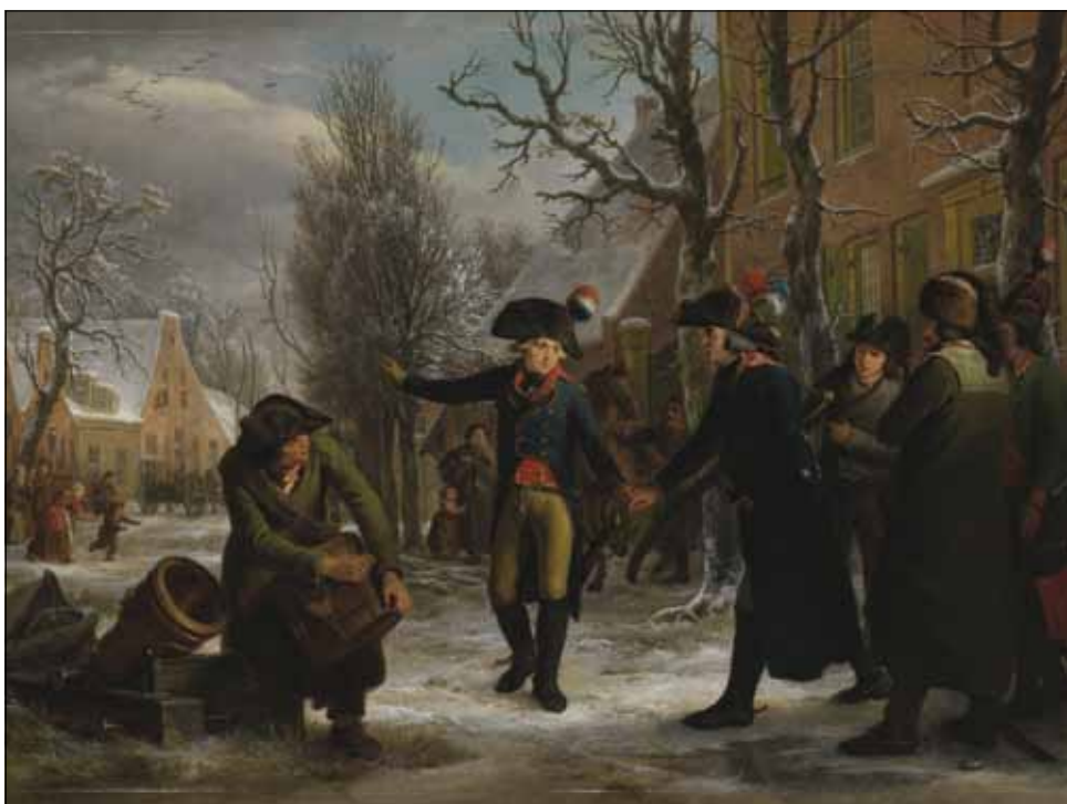
10 Oud-patriot Herman Daendels (in Frans generaalsuniform) neemt afscheid van mede-patriot Cornelis Kraijenhoff, te Maarsse, op 19 januari 1795. (olieverf, Adriaan de Lelie, Egbert van Drielst, 1795, Rijksmuseum)

Op 13 januari was het plan voorgelegd aan de Staten Generaal in Den Haag, maar de aanwezigen wilden geen besluit nemen over zo'n verzoek. In plaats daarvan werden twee vertegenwoordigers naar Pichegru gestuurd om te onderhandelen over een wapenstilstand, ten minste voor de tijd dat twee andere diplomaten nog onderhandelden in Parijs. Daar waren al vanaf de eerste oorlogshandelingen de afgevaardigden Brantsen en Repelaar bezig om een diplomatieke oplossing te vinden.