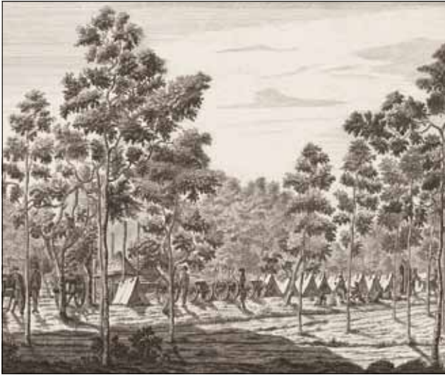
3 Artilleriekampement op een boerderij (prent, 1787, anoniem, Rijksmuseum)

Ook andere plaatsen kregen te maken met de komst van gewonden. In Utrecht konden de gewonde militairen niet meer worden geborgen in het Catharinaziekenhuis, dat daarvoor was ingericht. De regenten van het Barbara- en Laurensghasthuis weigerden soldaten op te nemen. Die werden vervolgens in het kapelletje van de Domkerk verpleegd. Amersfoort kreeg grote problemen met inkwartieringen en verplaatste de zieken naar de dorpen rond de stad. In Woudenberg vorderde een officier van de Huzaren van York het huis Groenewoud om zijn zieken in onder te brengen. Hij werd teruggestuurd door de Staten van Utrecht. Als hij een hospitaal nodig had, dan kon hij dat bespreken met de schout van Woudenberg. Het was niet de bedoeling dat legereenheden zelf een hospitaal inrichtten. 18