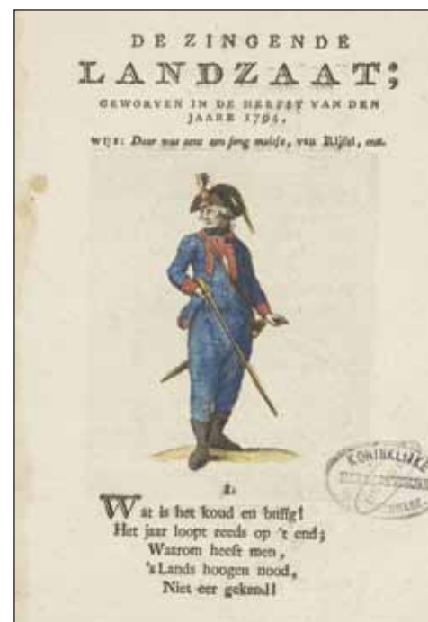
8 Landzaat (ingekleurde prent bij een liedje, 1794, Rijksmuseum)

De lasten van inkwartiering waren al maanden het zwaarst in de oostelijke helft van het gewest. In het westen verhinderden de inundaties dat daar grote eenheden zouden neerstrijken. Sommige dorpen waren daar alleen nog maar per boot bereikbaar. Juist in de decemberweken van 1794 besloten de Engelsen dat zij zich bij een verdere doortocht van de Fransen zouden terugtrekken naar het oosten, naar de IJssel. Dit besluit impliceerde wellicht ook dat veruit de meeste eenheden zich in het oosten van de provincie ophielden.