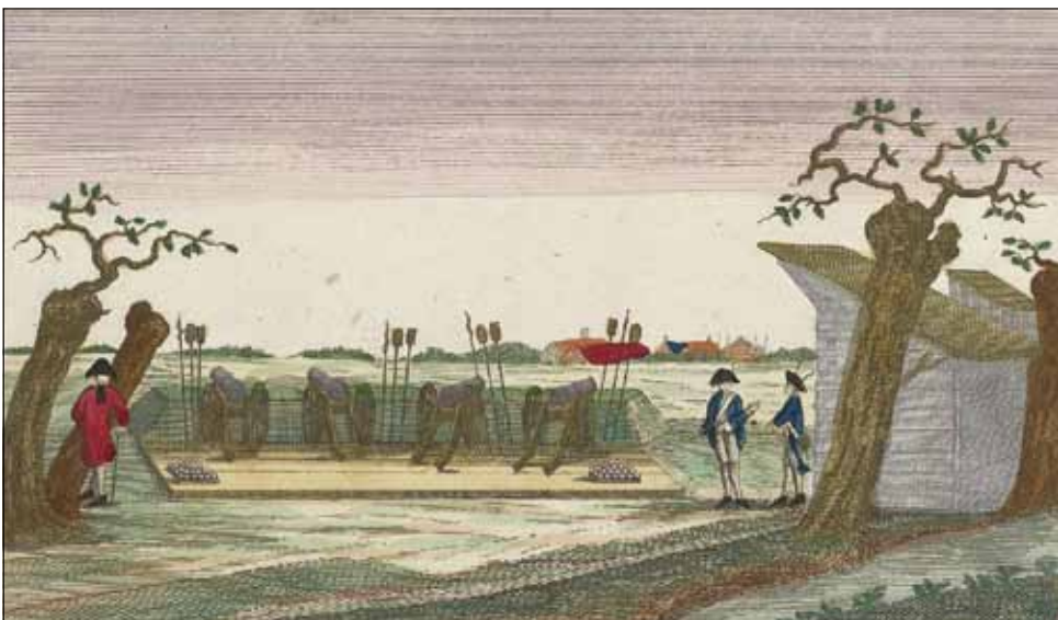
5 Voorbeeld van een batterij aan een rivier (ingekleurde prent, anoniem, 1787, Rijksmuseum, RP-P-OB-85.890)

boeren voor hun eigen werk geen paarden meer hadden. In de dorpen waar de artillerietrein lag, weigerden de dorpingen op den duur nog te rijden. De verplichte rijbeurten naar de werken aan de Grebbelinie vanuit Amersfoort en Hoogland werden steeds meer tegengewerkt. Maar juist aan de Grebbelinie waren wagens hoognodig. Daar was de onderwaterzetting gelukt: al het land buiten de linie, aan de Gelderse kant, stond onder water. Alles was klaar om de volgende stap te nemen in de verdediging, namelijk de aanvoer van kanonnen en munitie. Luitenant-kolonel Paravicini di Capelle, verantwoordelijk voor de artillerie aan de Grebbe, had daarom grote behoefte aan wagens. Hij vroeg de Staten alle kanonnen, affuiten (onderstellen), gereedschappen en andere voorzieningen die zich in de provincie bevonden, zo snel mogelijk naar de linie te vervoeren. Al het zogenaamde batterijhout dat in de linie was begraven, moest worden opgegraven zodat de bouw van de noodzakelijke kanon- en mortierbeddingen kon beginnen. Verder moest de provinciaal magazijnmeester naar Delft om daar alle beschikbare kogels te verkrijgen tot het kaliber 24-ponders. Zo waren niet alleen Straatman en Scherrenberg op zoek naar wagens en paarden in de provincie, maar ook de officieren aan de Grebbelinie. 29