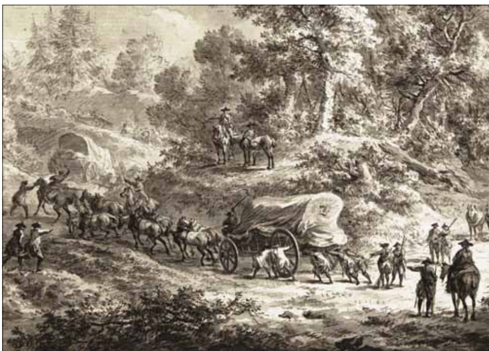
7 Legertransport (tekening, Dirk Langendijk, 1782, Rijksmuseum)

Het grote Engelse hospitaal van Rhenen kwam op 2 januari 1795 aan in Zwolle met 1.800 zieken en gewonden. Er waren 250 mannen in Rhenen achtergebleven omdat zij niet vervoerd konden worden. Dit lijken grote aantallen, maar vergeleken met het totale aantal Engelsen dat daar vanaf augustus verpleegd was, valt het mee, ook als men het aantal overledenen in ogenschouw neemt. In de maanden dat het hospitaal in het Koningshuis was gevestigd, waren daar dertig tot veertig soldaten per dag gestorven. In de vele massagraven van 3 tot 5 meter in het vierkant lagen bij vertrek van de Engelsen misschien wel vierduizend kisten opgestapeld tot 60 centimeter onder het maaiveld. Het was, om met een Engelse officier die het hospitaal bezocht te spreken, 'een perfect Golgotha'. 36