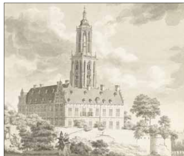
2 Koningshuis met de Cuneratoren, Rhenen (potlood, pen en penseel, Hendrik Hoogers, 1771, Rijksmuseum)

Op 30 juli 1794 kwam de oorlog de kamer van de Staten van Utrecht binnen. Een Engelse officier bracht een verzoek van de Britse opperbevelhebber, de hertog van York, tweede zoon van koning