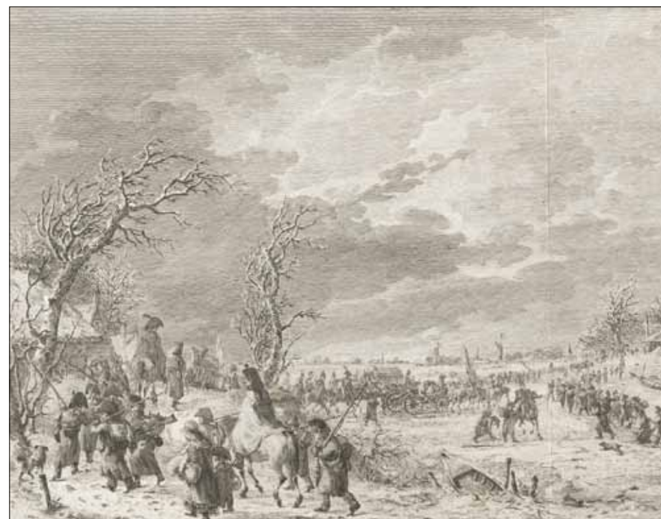
6 Fransen trekken over het ijs de Bommelerwaard binnen, 27 december 1794 (tekening, anoniem. Rijksmuseum)

In de loop van december kregen de Fransen er echter een belangrijke bondgenoot bij: de vorst. Op 16 december, toen de Franse opperbevelhebber generaal Pichegru na een kort ziekteverblijf in Brussel weer terugkeerde in 's-Hertogenbosch, begon een lange vorstperiode. Op 19 december moesten de Hollandse officieren het werk aan de batterijen aan de Lek en aan de Grebbe staken vanwege de dalende temperatuur. De Maas was al snel dichtgevroren en op de Waal, Rijn en Lek dreven ijsschotsen. Het verhaal over de Fransen die de Republiek binnenliepen over het ijs, begon zich hier te ontwikkelen. Maar zo eenvoudig was het niet. In de Betuwe dreigden bijvoorbeeld in november en december al enkele eenheden van de Fransen over de bevroren inundaties op te trekken. Maar prins Frederik, de tweede zoon van de stadhouder, liet daar de sluisen openen, zodat het water ging stromen en het ijs te zwak werd. Er werden 1.200 arbeiders ingezet om het ijs open te hakken. Zo deed men er alles aan om de doorgang over het ijs