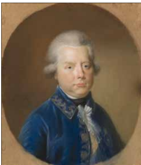
1 Willem V Batavus (1748-1806), Prins van Oranje, erfstadhouder van de Republiek der Verenigde Nederlanden (1751-1795) (pastel op perkament, Johann Friedrich August Tischbein, 1789, Rijksmuseum)

De bevolking van Utrecht merkte een jaar lang niet veel van de oorlog. 4 Of het moet de lange stoet van 75 wagens zijn die in de stad gemaakt waren en als 'veldtrein' van munitie-, brood-, smids- en bagagewagens naar het zuiden trok. Ook waren er natuurlijk brieven uit het zuiden, berichten in de Utrechtsche Courant en biddagen in de kerken voor steun van de Allerhoogste in de oorlog. Er waren regimenten die terugkeerden van gevechten in het zuiden en garnizoensdiensten innamen in Utrecht of Amersfoort. Maar tot halverwege 1794 was het een verre oorlog. Het gedreun van kanonnen in de verte was alleen vaag te horen in februari 1793 bij de beschietingen van Willemstad. 5