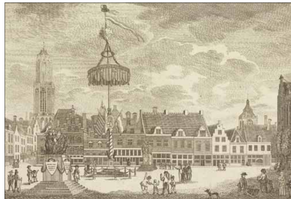
11 Vrijheidsboom op de Neude, hernoemd tot het 'Vrijheidsplein', voorjaar 1795 (prent, anoniem, Rijksmuseum)

De betaling van de kosten van de oorlog kreeg nog een lange nasleep. De rekeningen lagen weliswaar bij de Staten van Utrecht, maar de wereld was na 16 januari flink veranderd. In eerste instantie werden vanaf nu alleen de leveranties aan de Fransen vergoed. Daarvoor werd een commissie in het leven geroepen, maar die was niet bereid om de oorlogskosten van het oude regime te betalen. De Engelse Kanselarij meldde vanuit het Noord-Duitse Bremen dat declaraties van de dorpschouten tot april 1796 werden geaccepteerd. Sommige schouten vochten tot in Den Haag