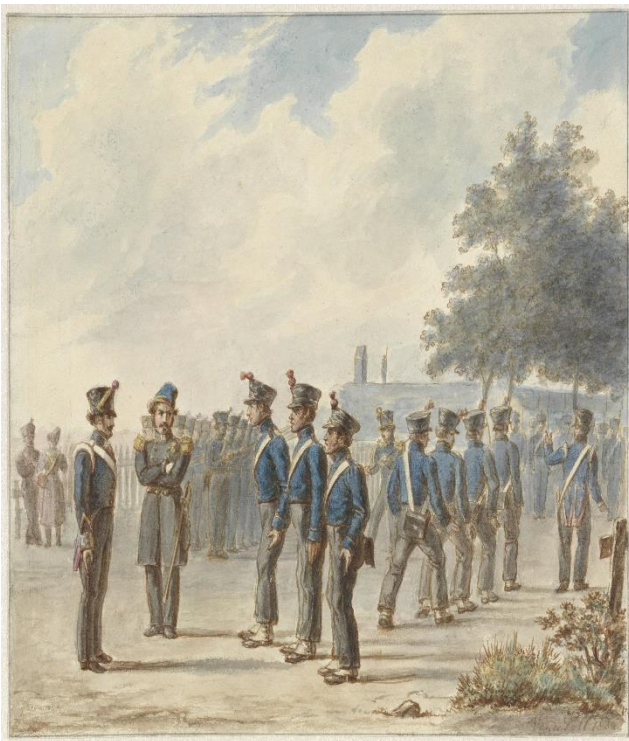
Nieuwe rekruten van een plattelandsschutterij op een exercitieveld 1834. Collectie Rijksmuseum Amsterdam; objectnr. RP-T-00-2273.

De mobilisatie van de rustende schutterij van het Drentse platteland kwam ondertussen in november en december 1830 met horten en stoten op gang. De indeling van de schutterijen uit de kleinere plaatsen in compagnieën van ongeveer 150 man zorgde bijvoorbeeld voor problemen. Daarnaast klopten de opgaven van schutters en vrijwilligers van de plaatselijke besturen lang niet altijd. Ook de militaire training van de plattelandsschutterij stelde vooralsnog weinig voor. Volgens gouverneur Hofstede moest er flink worden geoefend alvorens de manschappen van de rustende schutterij met de dienstdoende schutterij konden worden verenigd. Wat betreft zijn voorspelling in oktober 1830 dat het op het Drentse platteland geen storm zou lopen met aanmeldingen, kreeg hij gelijk. Terwijl zich begin november 1830 voor de Asser dienstdoende schutterij een kleine 60 vrijwilligers had aangemeld, bleef de teller voor de rustende schutterij vooralsnog op slechts zeven vrijwilligers staan. 54