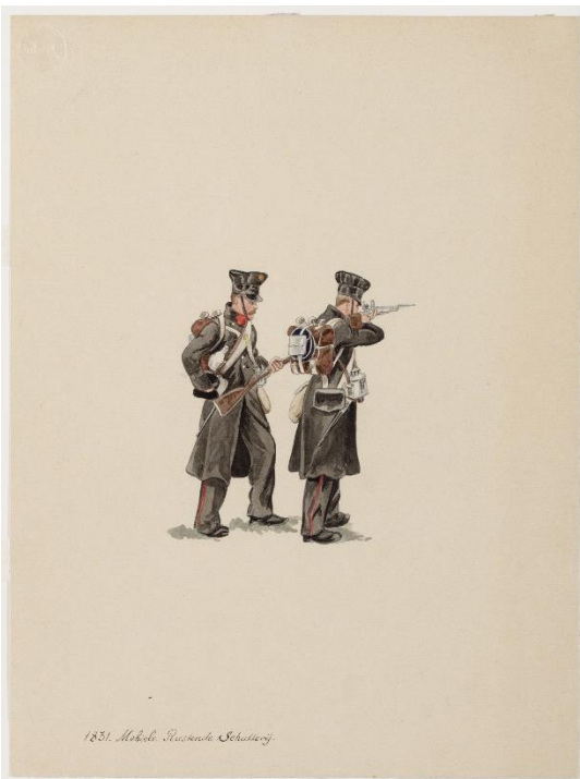
Mobiele rustende schutterij in 1831. Collectie Nationaal Militair Museum Soesterberg; objectnr. 00123780.

De mobilisatie had verstrekkende gevolgen voor het leven op het Drentse platteland. Er