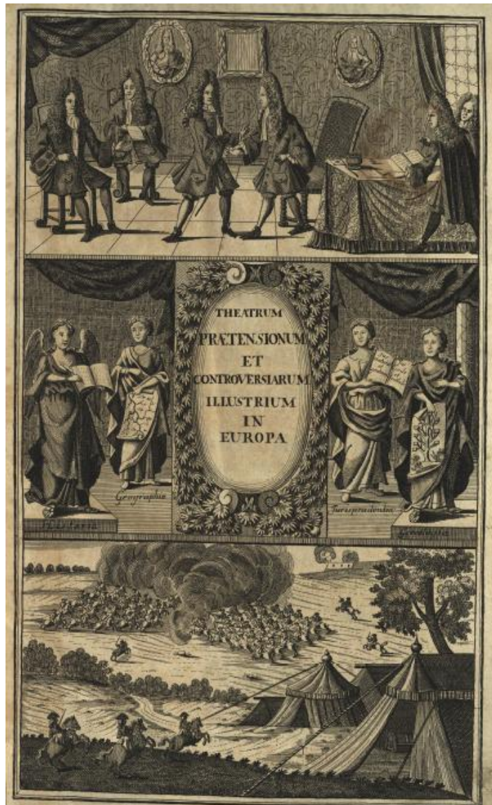
Figuur 7 Voorpagina van Christoph Hermann Schweders Theatrum Historicum praetensium et controversiarum illustrium , (1727 147 )

gekwalficeerd in privaatrechtelijke, feodale, of grondwettelijke termen, maar in een voor alle spelers aanvaardbare taal: het droit public de l'Europe 146 , of het recht van de prinsensamenleving.