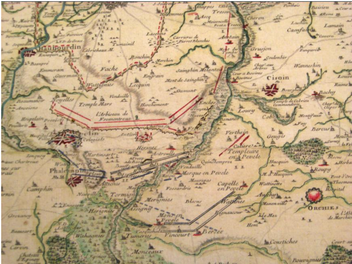
Figuur 4 De Franse ontzettingspoging van Rijsel, begin september 1708 (blauwe lijnen 84 )

1711) 83 om het bolwerk te verdedigen. Voor de Franse lange-termijnstrategie was het belang van Rijsel nauwelijks te onderschatten.