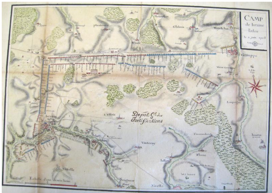
Figuur 2 Het Franse kamp te Eigenbrakel, waar de maand juni in een afwachende positie werd doorgebracht (S.H.D., archives du Génie 48 )

Lodewijk XIV had de bevoegdheidsverdeling tussen beide heren niet verduidelijkt. Bourgondië kon alleen beslissen ( voix de décision ), maar was verplicht de aansporingen en adviezen van Vendôme in te winnen ( voix d'exhortation ) 45 . Op die manier behield Lodewijk zich het recht voor de uiteindelijke beslissing te kunnen nemen. Samen met de markies van Chamlay (1650-1719) 46 en in mindere mate de Staatssecretaris van Oorlog Michel Chamillart (1652-1721) 47 , overlegde de koning vrijwel dagelijks met de generaals in de Nederlanden. Vooral de lange memoranda van Chamlay tonen aan hoe grondig Versailles op de hoogte was van de geografische en strategische factoren die de campagne beheersten. De rol van de bevelhebber was in de feiten beperkt tot de korte termijn-uitvoering van de instructies uit Frankrijk.