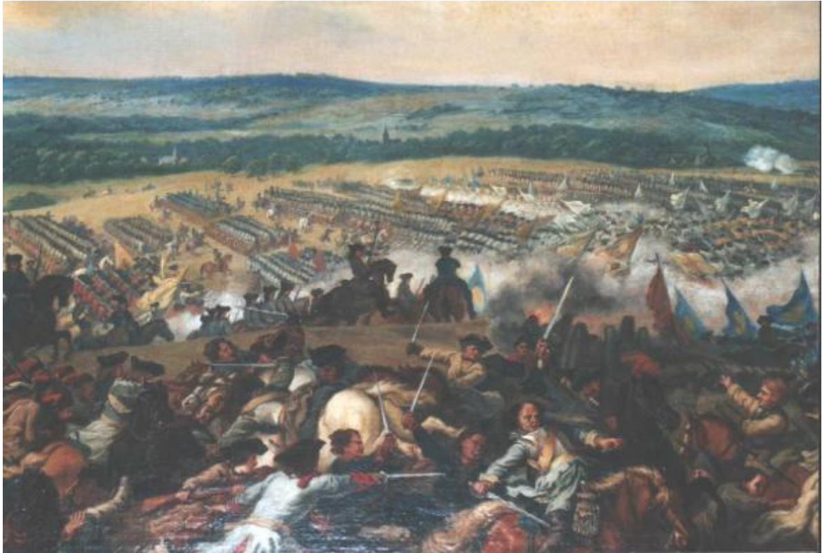
Figuur 3 De slag bij Oudenaarde, ingekleurde gravure van Jan Van Huchtenburg (privé-collectie)

De Slag bij Oudenaarde valt uiteen in een aantal kernfasen: de oversteek van de Schelde door het geallieerde leger rond tien uur 's ochtends (1), de aanval van Markies de Grimaldi 72 in de late namiddag, die de strijd deed ontbranden op een ongunstig terrein (2) en de omsingeling van het Franse leger door Ouwerkerk, die gestopt werd door de invallende duisternis (3). Telkens werd het verdere feitenverloop bepaald door een sterke fog of war . Het numeriek sterkere Franse leger slaagde er niet in om Marlborough in één beweging over de Schelde te jagen en verwaarloosde het om een heuvelrug (de “Hoogten van Ooike”) op haar rechterflank te bezetten, waardoor aan het einde van de dag de Staatse cavalerie van Johan Willem Friso (1687-1711) vrijwel ongehinderd tot aan het hoofdkwartier van de prinsen Bourgondië en Berry kon doordringen.