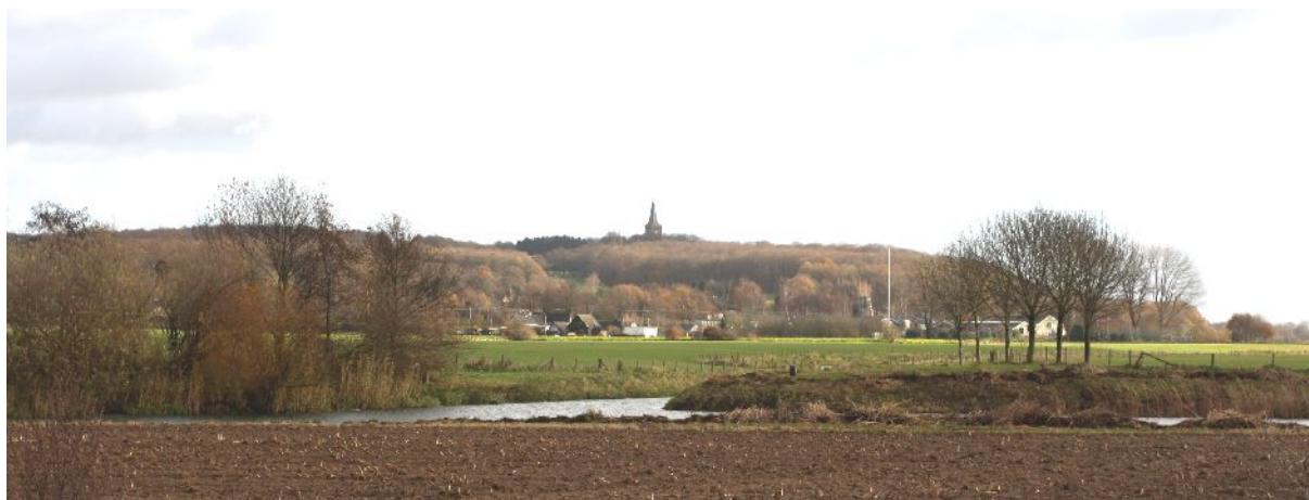
Het voormalige schiereiland 'Het Spijk'. Op de voorgrond een restgeul van de Rijn. Op de achtergrond de Elterberg met de toren van de abdij.

In 882 sloot Guðröðr in Asselt een overeenkomst met de Frankische koning Karel III de Dikke, die inmiddels zijn overleden broer Lodewijk de Jongere was opgevolgd. De Deen werd als hertog over de voormalige gebieden van Hrœrekr, waaronder het rivierengebied, aangesteld. Nadat hij een stevige positie in onze kuststreken had verworven, sloot hij zich aan bij de opstand die de nakomelingen van Lotharius II hadden ontketend om de soevereiniteit van Lotharingen – nu ingelijfd bij het Oost-Frankische rijk – aan zich te trekken. Bij deze opstand lieten de Friezen zich niet onbetuigd. Vooral de Friese graaf Gerulf speelde een wezenlijke rol aan de zijde van Guðröðr door zijn aandeel in het Lotharingse complot. 66