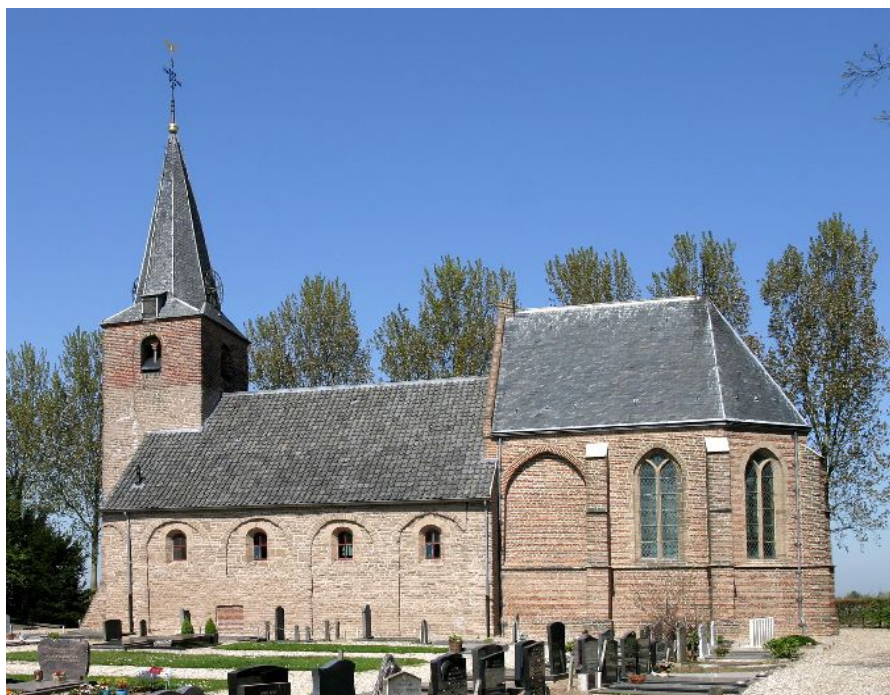
Hervormde kerk in Wadenhoijen met romaanse toren en schip in tufsteen uitgevoerd.

De bezetting van Dorestad werd in 850 door Lotharius formeel bevestigd: Hrœrekr herkreëg de handelsplaats op voorwaarde dat hij de Friese kusten zou verdedigen. Daardoor herstelden de betrekkingen tussen Lotharius en zijn Deense vazal zich weer. 54 Volgens de annalist Prudentius kreeg Hrœrekr Dorestad en 'andere graafschappen' overgedragen. 55 Het is niet bekend of onder die graafschappen ook de Betuwe was begrepen, maar dat is wel aannemelijk. Later zou blijken dat Lotharius goederen in de villa Gendt in de Over-Betuwe aan Hrœrekr had afgestaan. Het betrof koningsgoederen die Lotharius II in 860 ex rebus juris nostri ex beneficio Hrorici (uit de zaken die ons rechtens toebehoren uit het bruikleen van Hrœrekr) aan de abdij van Lorsch had geschonken. 56 Hrœrekr had zich ondertussen tot een gewaardeerde vazal van de Frankische koningen ontwikkeld. We mogen dan ook aannemen dat de vervreemding van de Gendtse goederen met zijn instemming geschiedde.