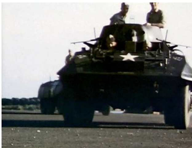
Greyhound verkenningswagen met Amerikaanse ster – still uit de film Brigadeflitsen (NIMH)..