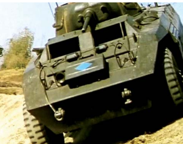
Greyhound verkenningswagen met Amerikaanse ster in het blauw overgeschilderd – still uit de film Brigadeflitsen (NIMH)..

In dit frontgebied had de lokale bevolking het het zwaarst. Enerzijds moesten de inwoners geregeld troepen van de TNI (en profiteurs die zich daarvoor uitgaven) huisvesten en helpen, anderzijds zagen zij hun rijstvelden verklaard tot gevechtsterrein of 'niemandsland'. In de hoop op terugkeer naar de 'normale toestand' heetten zij de Nederlandse troepen vaak welkom, maar als die zich weer terugtrokken achter de demarcatielijn was de inlandse bevolking terug bij af. In de binnenlanden, die nauwelijks door de vijandelikheden getroffen werden, vonden de Nederlanders later een veel minder hartelijke ontvangst. Het beeld van de 'bevrijdende' mariniers dat →