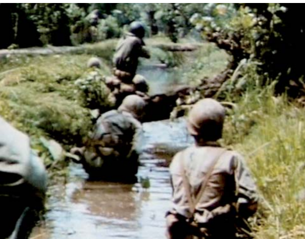
Een oprukkend peloton in vuurgevecht – still uit de film Brigadeflitsen (NIMH).

In augustus 1945 capituleerde Japan en riep Sukarno de Republiek Indonesië uit. Nederland echter wilde zijn voormalige kolonie terug en de honderdduizenden Nederlandse geïnterneerden in de Archipel bevrijden. In oktober 1945 landden Britse troepen om een interim-bestuur te vestigen. Op Java beperkten zij hun aanwezigheid tot Batavia (Jakarta) en Soerabaja, de voormalige Nederlandse marinebasis. Vooral daar was het republikeinse verzet tegen de komst van de zesduizend man sterke Brits-Indische troepenmacht uiterst fel, wat op 10 november leidde tot de "slag om Soerabaja", waarbij ruim zeshonderd Brits-Indische en zesduizend Indonesische slachtoffers vielen. Tweehonderdduizend inwoners sloegen op de vlucht. De Britten legden een cordon vooruitgeschoven posten in een straal van zestien tot twintig