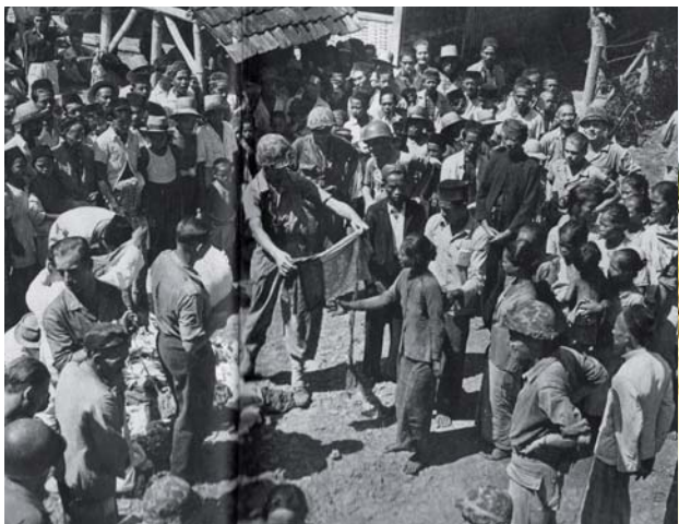
Kledinguitdeling, in Hugo Wilmar, Met de Mariniersbrigade in Oost-Java (blz 110-111, Spaarnestad 1948).